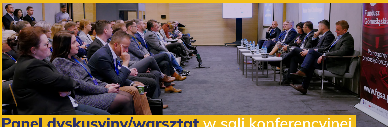
Panel dyskusyjny/warsztat w sali konferencyjnej