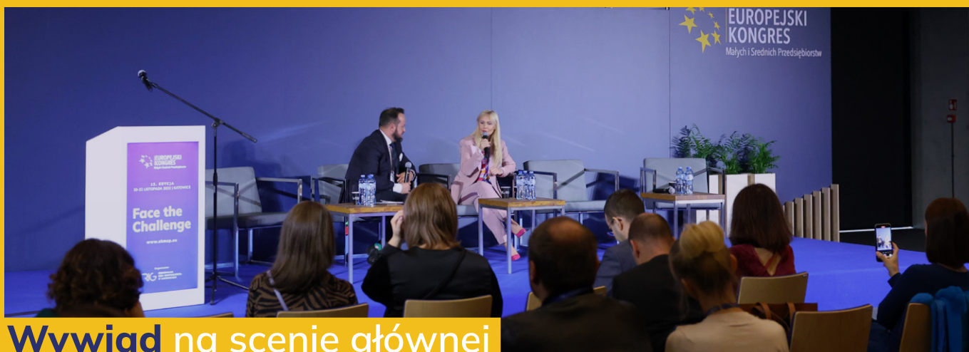
Wywiad na scenie głównej