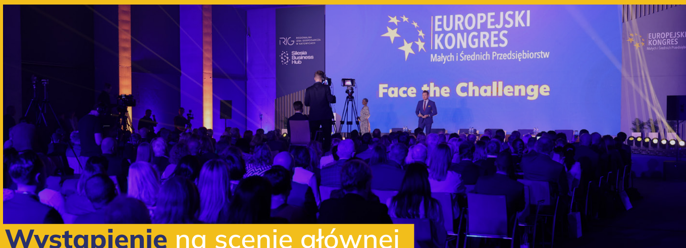
Wystąpienie na scenie głównej