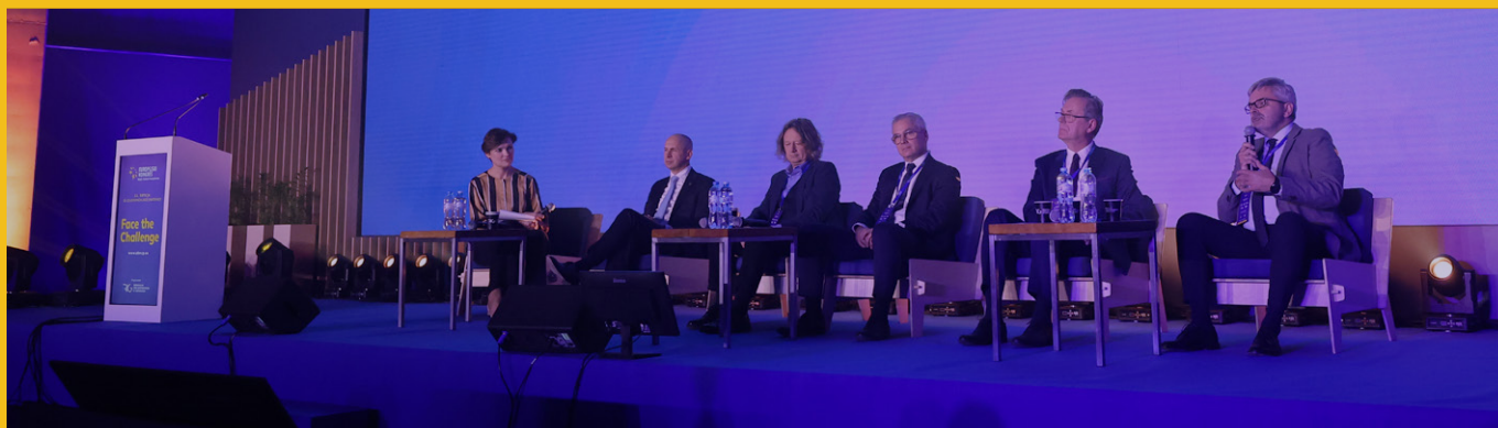
Moderowana debata na scenie głównej